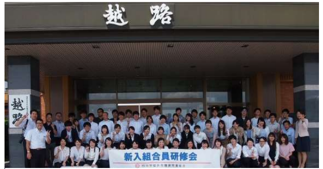
2019 新入組合員研修会

また、越路の研修を開催できなかった採用年度の職員(2020～2022 入庁)を対象に、越路での研修を開催します。仕事に慣れてきた 2～4 年目の職員が感じていることや考えていることについて、ワークショップを通じ意見交換することを企画しています。同期の仲が深まった記憶がある越路での研修に、先輩職員の皆様からも参加を後押しください。対象組合員の参加にご理解とご協力をお願いします。