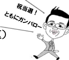
私たちの組織内議員 「むらっちゃん」